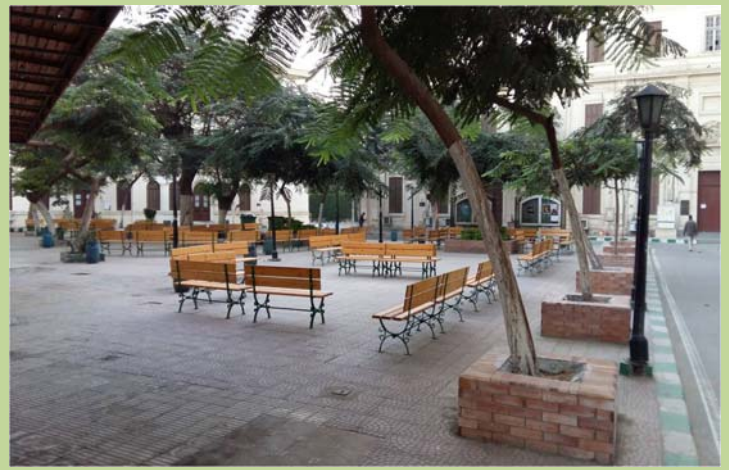
المقاعد وأحواض الزرع بعد التأهيل - خلف مبنى الإدارة