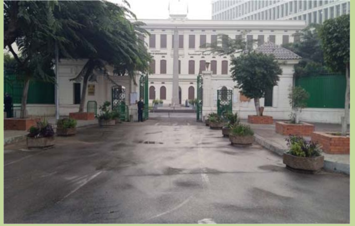
أحواض الزرع بعد التأهيل أمام المدخل الرئيسي للكلية