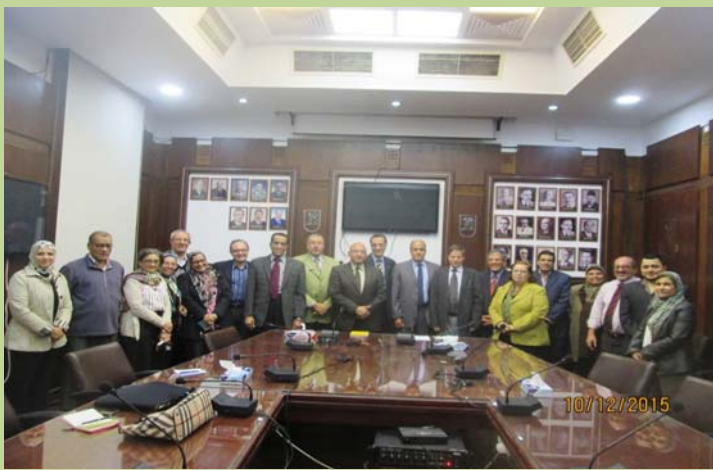
زيارة فريق المراجعين من الهيئة القومية لضمان الجودة والاعتماد للكلية