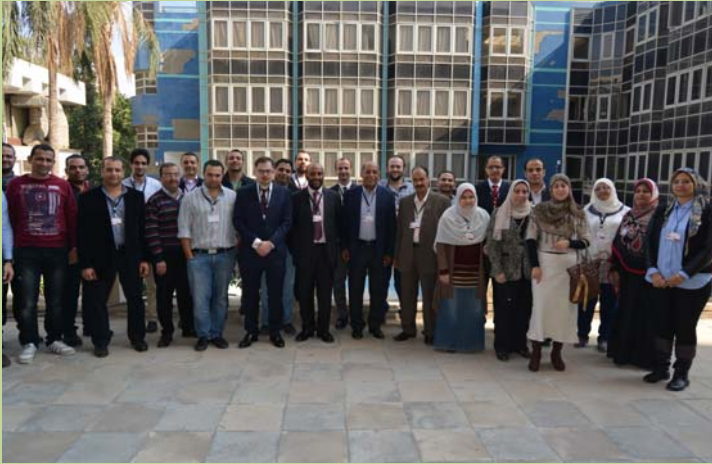
المشاركون في دورة " إنترنت الأشياء Internet of Things "