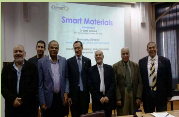
محاضرة عامة عن التكنولوجيات الذكية " SMART TECHNOLOGIES "