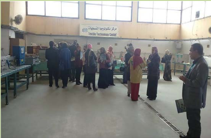
ورشة عمل " تكنولوجيا النانو وتطبيقاتها في صناعة المنسجات "

الميكانيكي والإنتاج في وظيفة أستاذ مساعد بالقسم مع التهنئة .