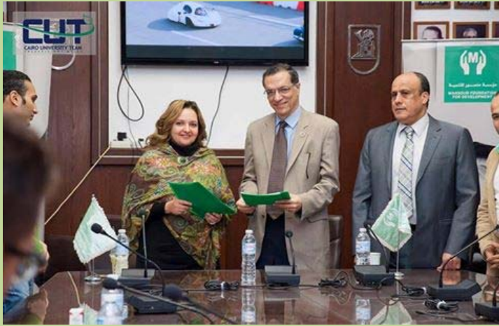
توقيع مذكرة تفاهم مع مؤسسه منصور للتنمية لدعم فريق شل للسيارات بالكلية