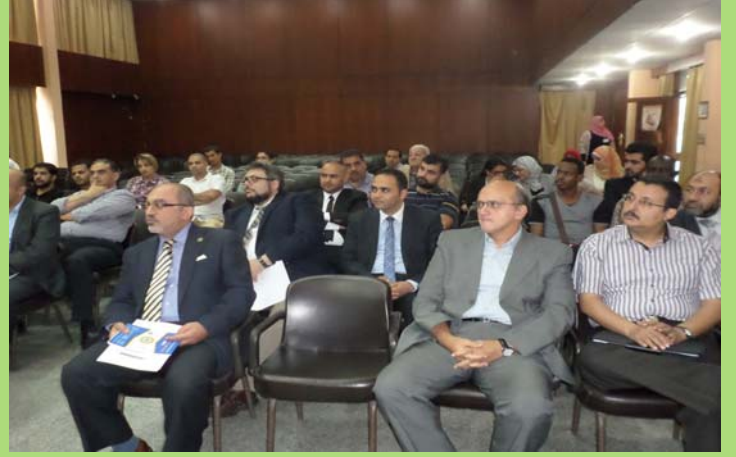
لقاء بين طلاب الدراسات العليا الوافدين وعدد من أعضاء هيئة التدريس