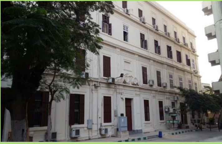
واجهة المدخل الرئيسي لمبنى ء بعد الانتهاء من أعمال الإحلال والتجديد