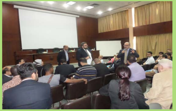
لقاء بين طلاب الدراسات العليا الوافدين وعدد من أعضاء هيئة التدريس