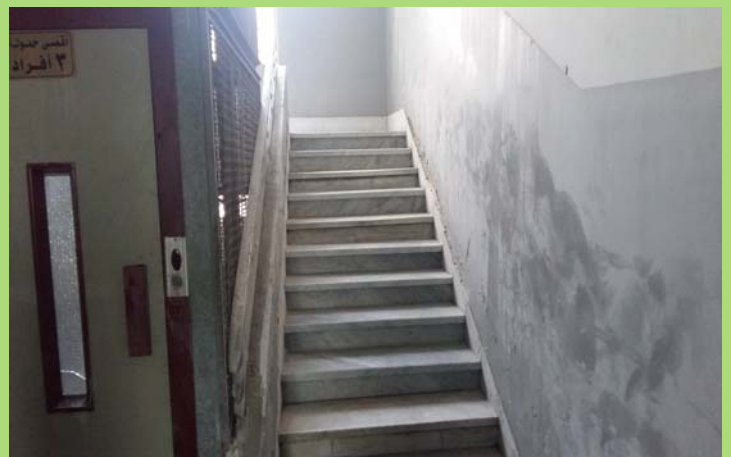
درج السلم بجوار مصعد مبنى ري وهيدروليكا بعد أعمال الإحلال والتجديد