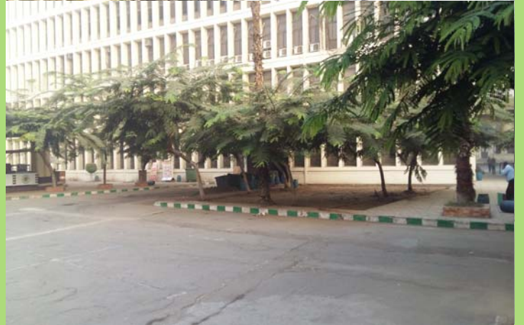
موقع إستراحة الطلاب قبل أعمال الإحلال والتجديد