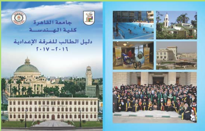
الغلاف الخارجي لكتاب دليل الطالب للفرقة الإعدادية