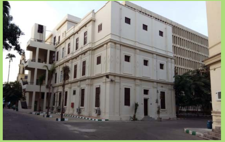
الواجهة الشمالية والشرقية لمبنى ء بعد أعمال الإحلال والتجديد