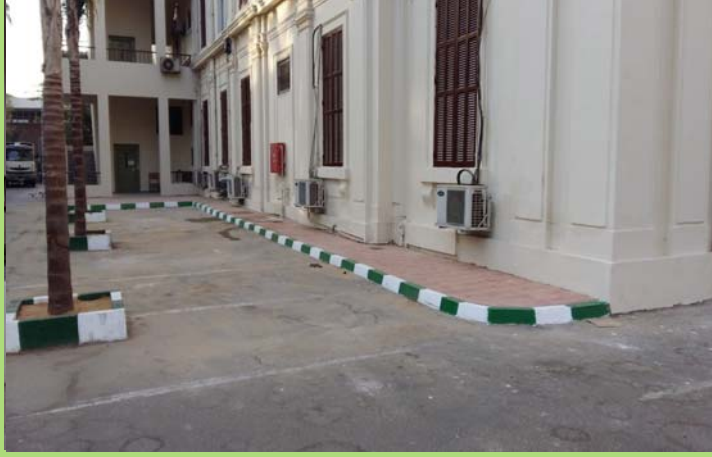
الرصيف والبردورات بجوار الوحدة الحسابية بعد الإحلال والتجديد