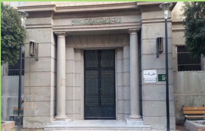
المدخل الرئيسي لمبنى الري والهيدروليكا بعد أعمال الإحلال والتجديد