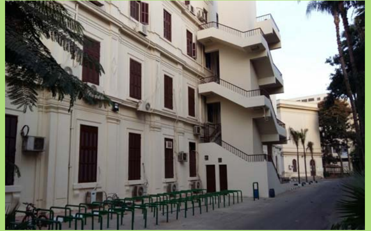
سلم المعمل الافتراضي على الواجهة الشرقية بعد أعمال الإحلال والتجديد