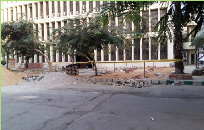
موقع إستراحة الطلاب أثناء أعمال الإحلال والتجديد