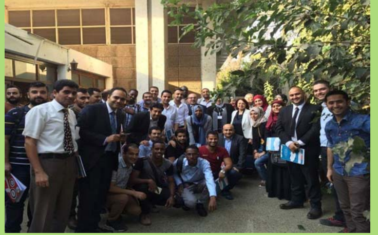
لقاء بين طلاب الدراسات العليا الوافدين وعدد من أعضاء هيئة التدريس